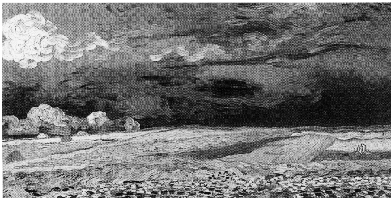
CAMPOS DE TRIGO BAJO UN CIELO NUBLADO. VINCENT VAN GOGH (1853-1890)